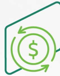
Capital de giro