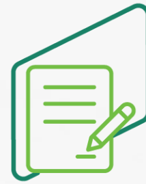
Prestação de garantia (fiança bancária)